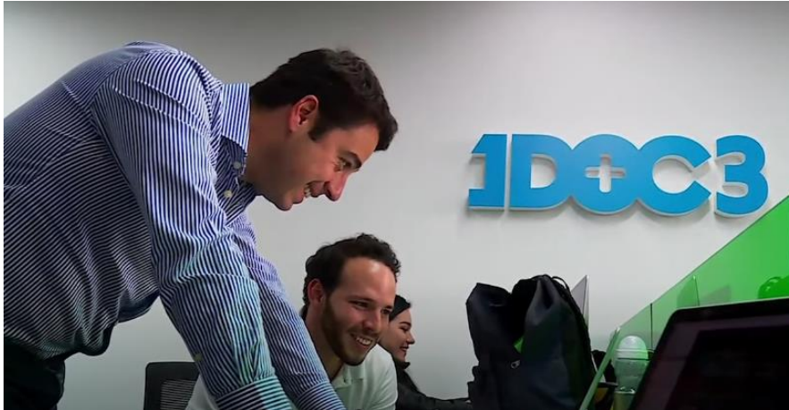
Imagen 9: 1DOC3 ha generado desarrollo y pivotado la medicina al alcance de todos.

del Futuro. 1DOC3 también ha aprovechado la articulación con el ecosistema que estaba anteriormente y como si fuera poco se convirtieron en eje fundamental en pandemia y pos-pandemia. Asimismo, ofrecen un servicio que se basa en un tema de acceso a medicina dentro de una burbuja de internet. Allí, esa información no está validada, pero ellos se encargan en que esas referencias que se dan por médicos, sean a través de un fluido verificado, de que las personas, empresas o corporaciones puedan tener acceso a ello. 1DOC3 es uno de los grandes ejemplos de cómo ha ido evolucionando este sistema.