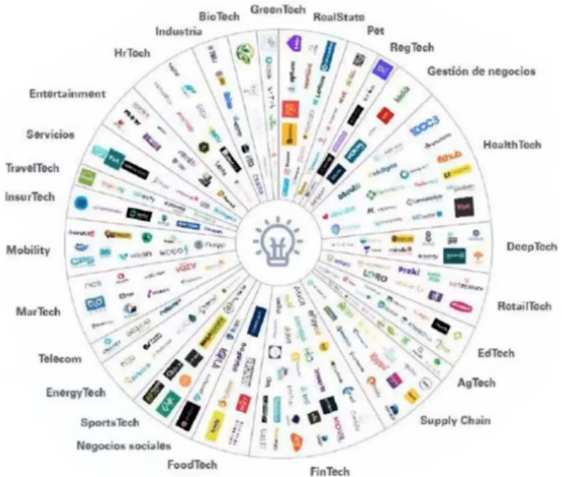
Imagen 7: En Colombia se vienen dando pasos importantes hacia el desarrollo de recursos más culturales, tecnológicos e intangibles.

pueda replicarse a un ecosistema. Para eso viene trabajando Andi del Futuro. En la siguiente gráfica se observarán diferentes sectores con sus respectivos procesos.