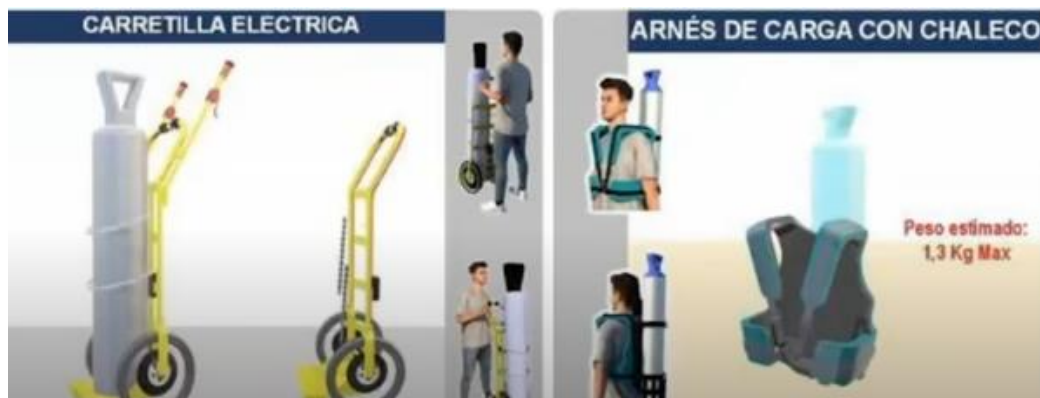
Imagen 14: Los desarrollos compartidos han sido claves en la empresa Fasem.

Hablar de estos temas de desarrollo empresarial han sido prioritarios para Andi del Futuro. Todas las conversaciones sobre lo que se avecina significa invertir en empresas que están en alto crecimiento, que tienen en la cabeza cosas que vienen sucediendo en el mundo, que están seguras de lo que puede pasar prontamente en el planeta y que van construir escenarios con grandes empresarios, lo cual significa estar un paso más allá del desarrollo de negocio sostenible. Los ejemplos presentados se conocen y se cruzan en varios principios fundamentales, como sostenibilidad, crecimiento rápido, impacto colaborativo, valor compartido y desarrollo. Las empresas que lo han implementado entienden su medida del éxito, el impacto que pueden generar y están comprometidas con futuros sostenibles y diferentes.