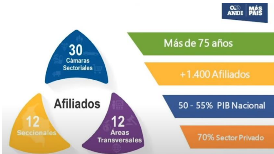
Imagen 2: La Andi aporta alrededor del 55% de PIB en Colombia.

Ahora bien, es importante resaltar que la Andi cuenta con una estrategia nacional y esta tiene una mega (aspiración dentro de los siguientes años) cuyos propósitos son liderar activamente desde el sector empresarial; también desde la reactivación económica del país, con propuestas que generen empleo de calidad y aceleren el crecimiento de corto plazo; asimismo, buscará contribuir con acciones que le permitan a Colombia en el 2025 ser uno de los tres países más competitivos en Latinoamérica, pero además, promoverá el posicionamiento de las empresas como generadoras de progreso en las regiones del país y le apuntará a ser protagonistas en la búsqueda de los objetivos de desarrollo sostenible, principios de capitalismo consciente, la libre empresa y la democracia.