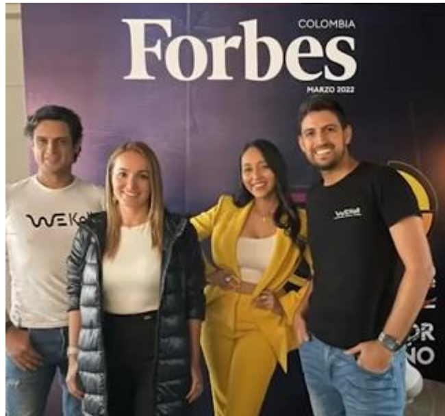
Imagen 6: Con el paso de los años el emprendimiento de Colombia ha ido avanzando de manera positiva.

Tal y como su nombre lo indica, este programa se enfoca en el futuro, principalmente en que se pueda generar un impacto de calidad; los congrega el emprendimiento como un cómo , es decir, un método para generar desarrollo compartido y su propósito es que las empresas crezcan. Se debe tener en cuenta que la conexión entre compañías en Colombia no resulta necesariamente fluida. La sinergia y el networking no es tan natural como se esperaría en una comunidad de colaboración, por eso dentro de ella se ejerce una articulación importante donde se abren espacios para que se creen emprendimientos colaborativos y se generen desarrollos al siguiente nivel. Para que esto sea posible se debe pensar en el futuro y no como un tema lejano o político. No tiene que ver con lo que pasará, sino con lo que se hará, lo cual significa que hay empresas que tienen una mentalidad estructurada sobre la forma en que pueden ocurrir los futuros y qué se podría hacer cuando estos se acerquen. Es decir, cómo vienen trabajando la ciencia de datos y desarrollos de tendencias globales alrededor de esto.