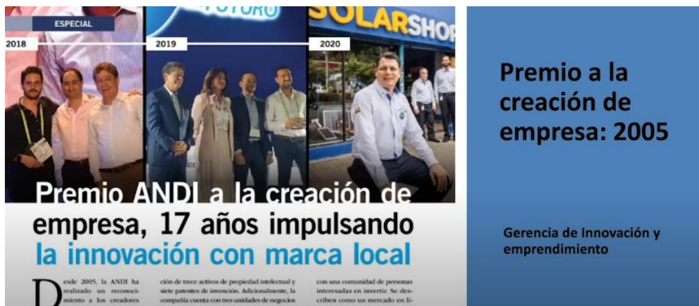
Imagen 3: Desde el año 2005 se viene impulsando la innovación con marca local.

Gracias a esa gestión y al desarrollo de organizaciones en el país se creó la Gerencia de Innovación y Emprendimiento, que fue pieza clave para que se desarrollara el programa Andi del Futuro, que congrega cerca de 300 empresas. Como programa tiene 17 años y como cámara tiene varios meses.