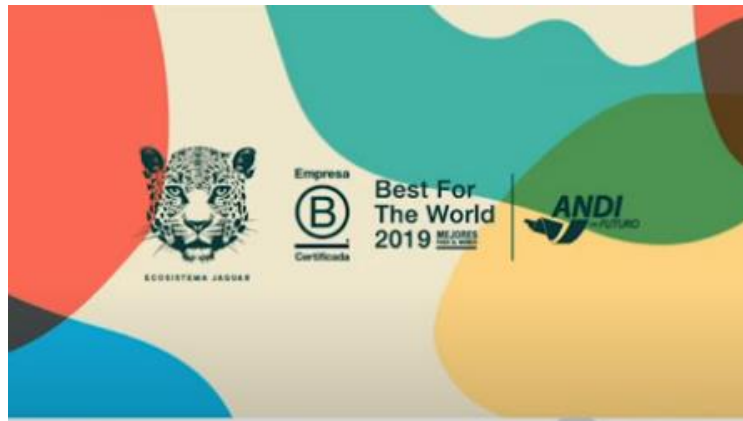
Imagen 11: Ecosistema Jaguar es un laboratorio agroalimentario para la innovación y el desarrollo rural de Latinoamérica.

Basados en esas premisas, Ecosistema Jaguar ha permitido entender que la asistencia es fundamental, toda esta parte se redonda en más calidad y mejores productos. En el país, alrededor de 65 mil empresas agropecuarias necesitan de ello para aumentar su producción, generar mejores prácticas, ser más conservacionistas y optar por la sostenibilidad.