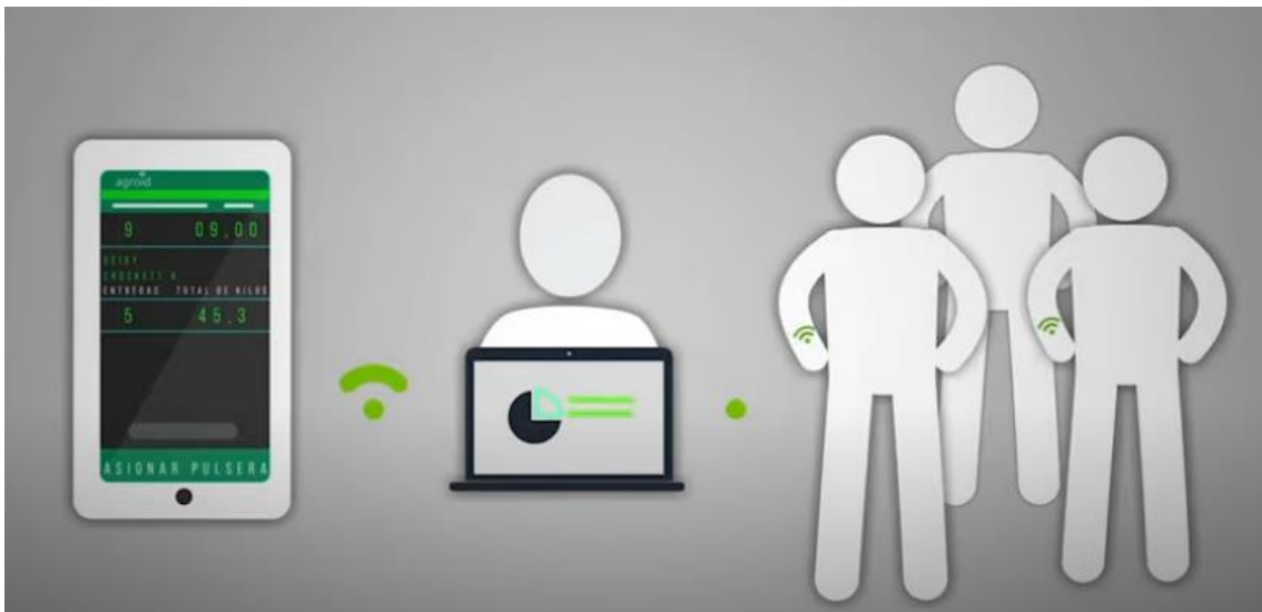
Imagen 10: Agroid ha sido clave para generar desarrollo en el agro colombiano.

Uno de esos casos es Agroid. Esta empresa hace parte de Andi del Futuro y ha hecho natural la integración de los procesos de tecnología al seguimiento, obtención de datos y a la generación de valor en el agro colombiano. Agroid se ha extendido y ha tenido contactos con algunos países latinoamericanos que han tenido los mismos retos. Esta organización se ha especializado en el desarrollo innovador de software de tecnología para la fruticultura y agroindustria. Generan desarrollo de contenidos, información y le permiten a las personas que lideran estos procesos de agro tomar decisiones en tiempo real y generar un menor impacto dentro de la siembra y recolección de todos los procesos del campo.