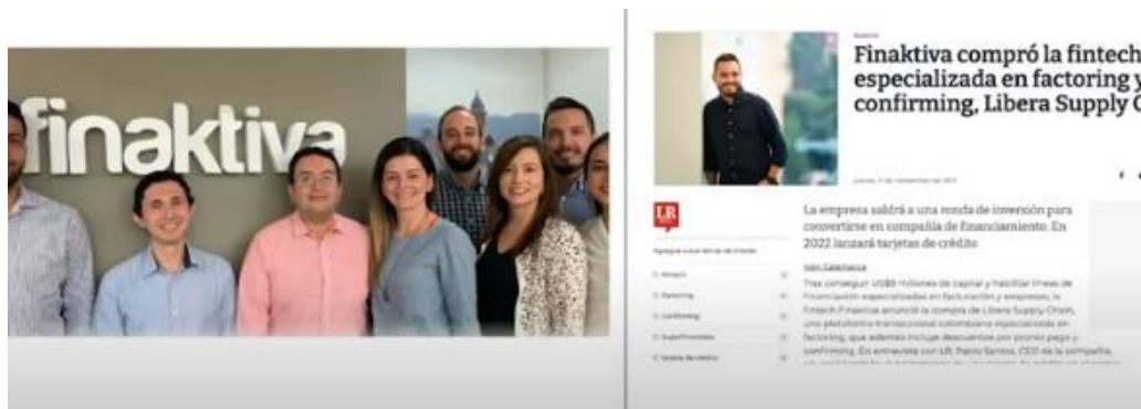
Imagen 13: Finaktiva es una de las organizaciones que mejor pivotea.

y se ha constituido como una de las principales empresas que tienen en la mira apoyar a emprendedores que necesiten acceder a recursos.