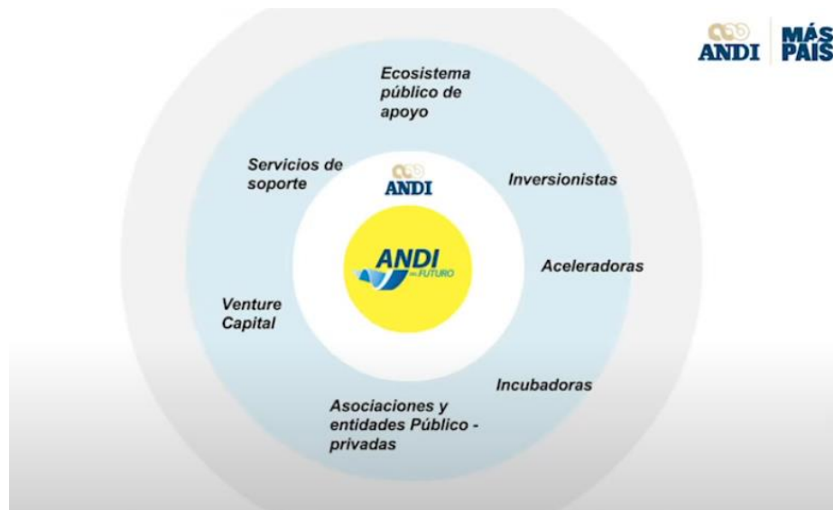
Imagen 5: Con el paso de los años el emprendimiento de Colombia ha ido avanzando de manera positiva.

Teniendo en cuenta lo anterior se debe analizar la manera en que funciona el ecosistema en Colombia y para entenderlo es clave observar la siguiente gráfica.