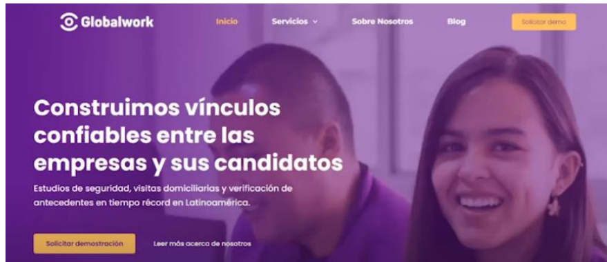
Imagen 12: Empresas como Globalwork han facilitado los procesos de recursos humanos.

en los sistemas de contratación de empresas en Colombia, incluso, han prometido realizar estudios para elegir a personas en 24 horas, algo que se ha convertido en un reto para una organización privada o pública, pues se podrían generar algunos sesgos invisibles o inconscientes. Sin embargo, con este tipo de iniciativas se trabaja para que esos sesgos no existan, gracias al desarrollo de tecnologías de seguridad con estudios mucho más avanzados.